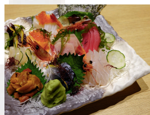
Il crudo di pesce